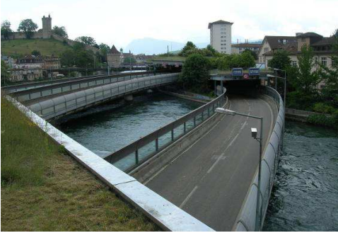
Abb. 1: Sentibrücke 3, Blickrichtung Sonnenberg (im Hintergrund Sentibrücken 1+2)