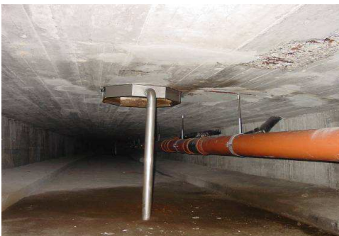
Abb. 3: Sentibrücke 2, Untersicht Fahrbahnplatte: Wassereintritt durch den Einstieg in den Brückenkasten, Betonabplatzung und Bewehrungskorrosion