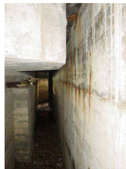
Abb. 4: Sentibrücke 3, Widerlagerrückwand: Bewehrungskorrosion, hervorgerufen durch Wassereintrag via undichtem Fahrbahnübergang

Die Nationalstrasse A2 überquert zwischen den beiden Tunnels Sonnenberg und Reussport die Reuss. Zusätzlich zu den eigentlichen Fahrspuren der Autobahn bestehen in Fahrt-Richtung Gotthard eine Ausfahrt nach Luzern sowie in Fahrtrichtung Bern/Basel eine Einfahrt. Mit insgesamt drei Brücken wird die Reuss und mit zwei weiteren Bauwerken die Stadtausfahrt überquert. Der Bau dieser fünf Brücken erfolgte zwischen 1972 und 1973.